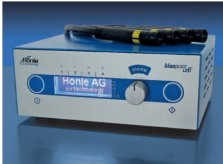
bluepoint LED eco

Der Punktstrahler bluepoint LED eco wurde für Anwendungen entwickelt, die eine hochintensive UV-Bestrahlung benötigen. Durch die hohe Intensität und die Möglichkeit der Programmierung kompletter Programmabläufe, wie beispielsweise Belichtungsfolgen mit unterschiedlichen Intensitäten und Wartezeiten, können insbesondere in vollautomatischen Fertigungslinien kürzeste Taktzeiten bzw. Maschinendurchlaufzeiten realisiert werden.